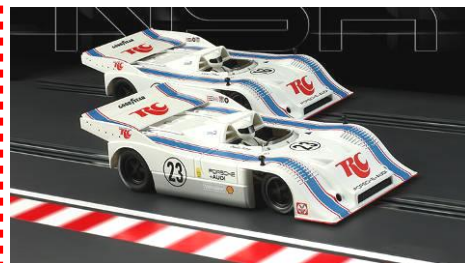
Foto ufficiale dell'ultima novità NSR, fornita in accoppiata nell'ormai classico cofanetto. Porsche 917/10K RC Cola.