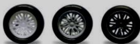
5422 - Ø 17mm BBS white 5426 - Ø 17mm BBS silver 5424 - Ø 17mm BBS black

9.3 I copricerchi sono obbligatori (NSR BBS o NSR 12 razze), possono essere incollati ai cerchi.