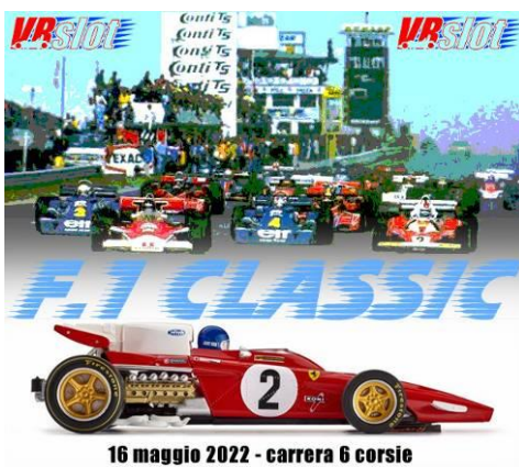
16 maggio 2022 - carrera 6 corsie

Nuovo appuntamento con le Formula 1 sulla Carrera!