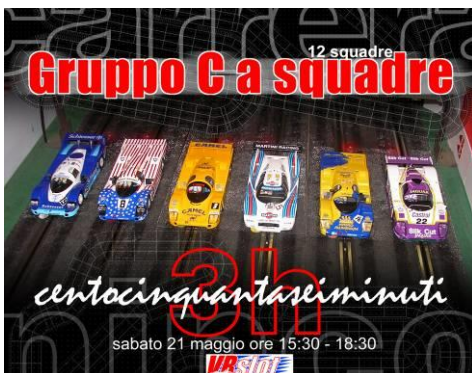
sabato 21 maggio ore 15:30 - 18:30

C'è ancora spazio tuttavia per le iscrizioni dell'ultimo minuto, sia di singoli partecipanti che di squadre.