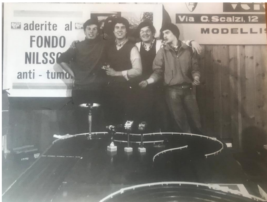
Motor Expo 1978, con il supporto di Autosprint.